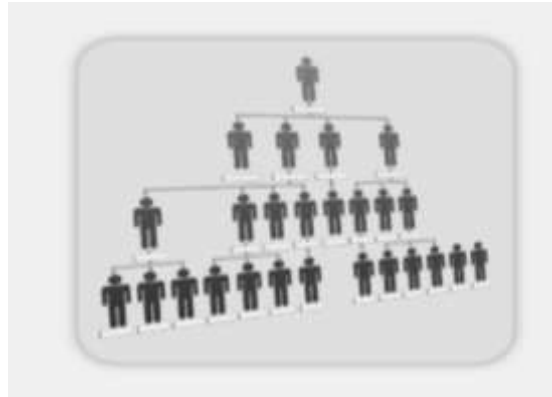
شکل ۴-۱: ارگونومی سازمانی

• ارگونومی سازمانی: مسائلی از جمله بهینه سازی سیستم‌های فنی-اجتماعی ۱ ، خط مشی‌ها و سیاست‌ها ۲ و فرآیندها ۳ در این شاخه تعریف شده‌اند. همچنین ارگونومی سازمانی شامل ارتباطات ۴ ، کار گروهی ۵ ، دورکاری ۶ ، مدیریت کیفیت ۷ ، کار مشارکتی ۸ و مواردی از این قبیل می‌باشد.