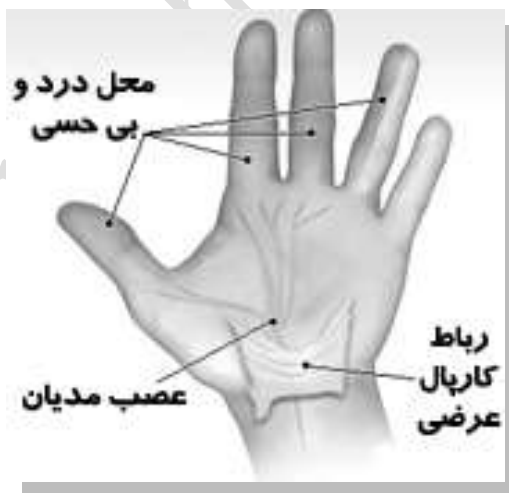
شکل ۱-۲: نشانگان تونل کارپال

۱- نشانگان تونل کارپال ۳ : تونل کارپال مجرای در مچ دست است که توسط استخوان‌های دست و رباط تونل کارپال محدود شده است. این تونل فضایی محکم بوده که از آن چندین زردپی، رگ خونی و نیز عصب مدیان عبور می‌کند. عصب مدیان انگشتان سبابه، میانه و ناحیه داخلی (سمت زند زبرین) انگشت انگشتر را عصب-دهی می‌کند. علائم نشانگان تونل کارپال عبارتند از: بی‌حسی، درد، سوزش، خارش و ناتوانی دست در انجام درست حرکات (شبهه حالتی که اندام به خواب می‌روند). اگر تورمی در درون تونل کارپال وجود داشته باشد یا فشاری بیرونی بر این ناحیه وارد شود، عصب مدیان فشرده شده و هدایت عصبی مختل خواهد شد. این نشانگان در بسیاری از مشاغل صنعتی از جمله صنایع خودروسازی و کارگران بسته بندی گوشت مشاهده و گزارش شده است. نام رایج این بیماری مچ تلگرافی‌ها می‌باشد.