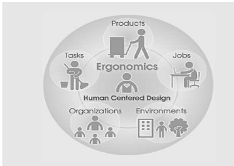
شکل ۱-۱: ابعاد کلی رشته فاکتورهای انسانی و ارگونومی

مدنظر قرار می‌دهد و هدف نخستین این دانش، طراحی است. شکل شماتیک زیر نمایی از ابعاد کلی رشته ارگونومی را نشان می‌دهد.